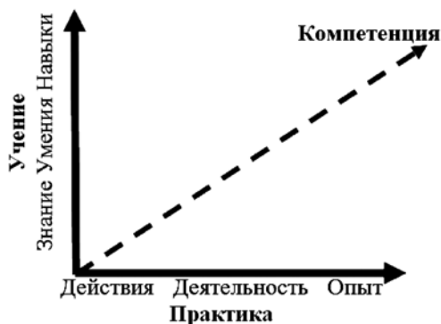
Рис. 2. Две стороны учения, обеспечивающие формирование коммуникативной компетенции в процессе овладения иностранным языком

Учение в классе и в реальности. Учение в процессе овладения иностранным языком и формирования коммуникативной компетенции неизбежно соединяет в себе как учебный процесс, так и накопление жизненного опыта практического применения изучаемого языка. Представим графическую модель этого процесса (рис. 2):