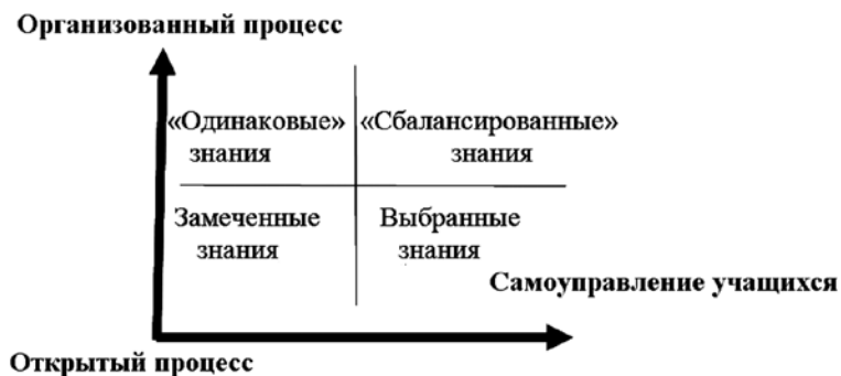
Рис. 3. Влияние внешней организации и управления на учение и усвоенные знания

Учение как управляемый и самоуправляемый процесс. Учение как вид познавательной деятельности можно охарактеризовать с точки зрения организованности и управляемости . Наиболее организованным и управляемым способом учения можно назвать обретение знаний в процессе их прямой передачи от учителя или учебника к обучаемому. Самой спонтанной и самоорганизующейся формой учения считается самостоятельное обретение знаний в «свободном плавании по жизни». Влияние внешней организации и управления на учение и усвоенные знания показано на рисунке (рис. 3):