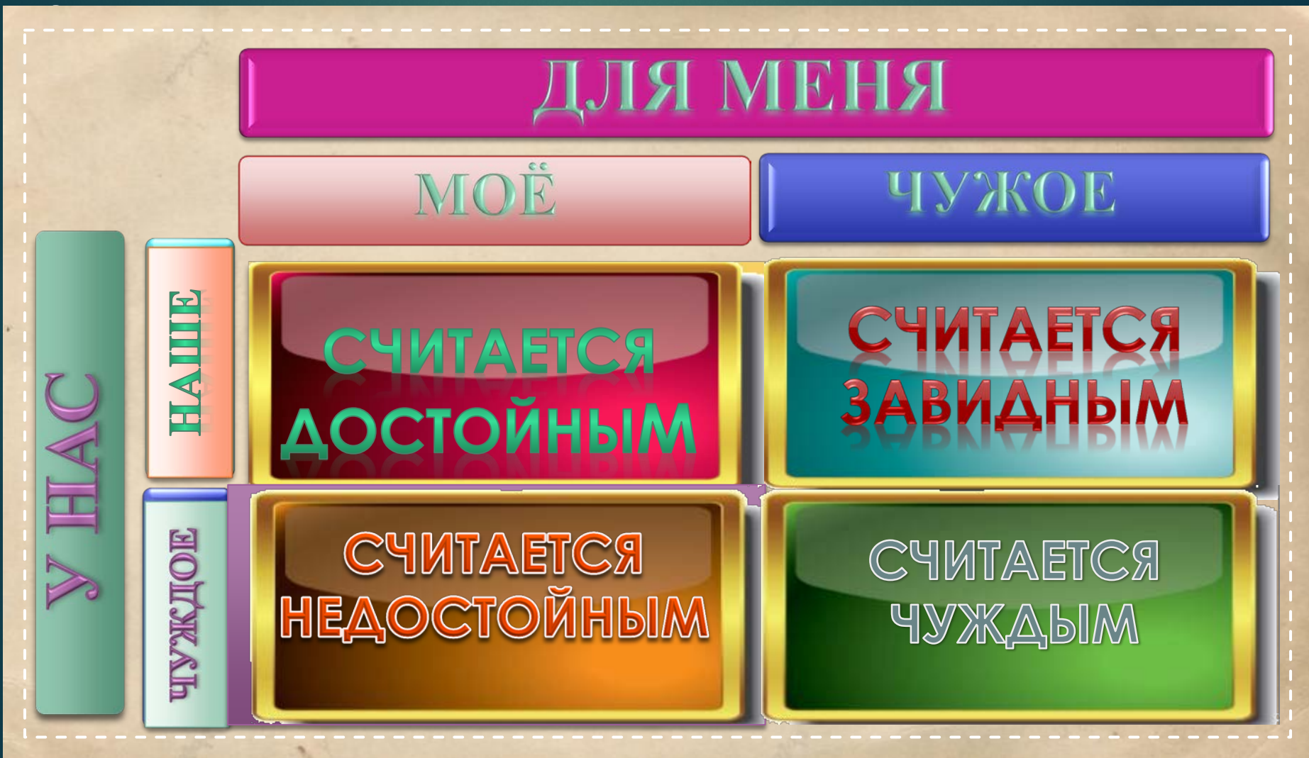
СХЕМА ПОЗВОЛЯЕТ ОТСЛЕЖИВАТЬ СТАНДАРТ РАСПРЕДЕЛЕНИЯ СМЫСЛОВ И ОЦЕНОК ПОСТУПКОВ В МЕЖКУЛЬТУРНОЙ